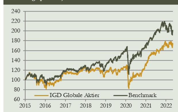
Udvikling i porteføljens afkast versus benchmark siden start

Investeringssforeningen Great Dane og Great Dane Fund Advisors A/S har alle rettigheder til dette produkt. Investeringssforeningen Great Dane og Great Dane Fund Advisors A/S påtager sig intet ansvar for, hvorvidt informationerne er fuldstændige, korrekte eller ajourførte. Anvendelsen sker alene på eget ansvar. Investeringssforeningen Great Dane yder ikke investeringsrådgivning. I intet tilfælde er Investeringssforeningen Great Dane og/eller Great Dane Fund Advisors A/S ansvarlige for tab, der måtte opstå som følge af brugen af dette produkt. Den, der anvender informationen eller dele heraf, bør være opmærksom på, at informationen afspejles ved tidspunktet for tilbivelsen og derfor hurtigt kan blive uaktuel. Opsparing gennem afdelinger i en investeringsforening indebærer altid en risiko. Historiske afkast er ingen garanti for fremtidige afkast. De penge, der placeres i en afdeling af en investeringsforening, kan både øges og mindskes i værdi, og det er ikke sikkert, at placeret kapital tilbagevindes.